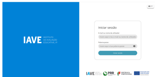
Figura 1 – Acesso à Plataforma de Realização de Provas do IAVE

(Obs.: Para as escolas que optaram pelo offline em rede ou standalone, os procedimentos para acederm à Plataforma de Realização de Provas do IAVE são os constantes no Manual Offline, publicado na Área Escolas do JNE, a 22 de janeiro de 2025)